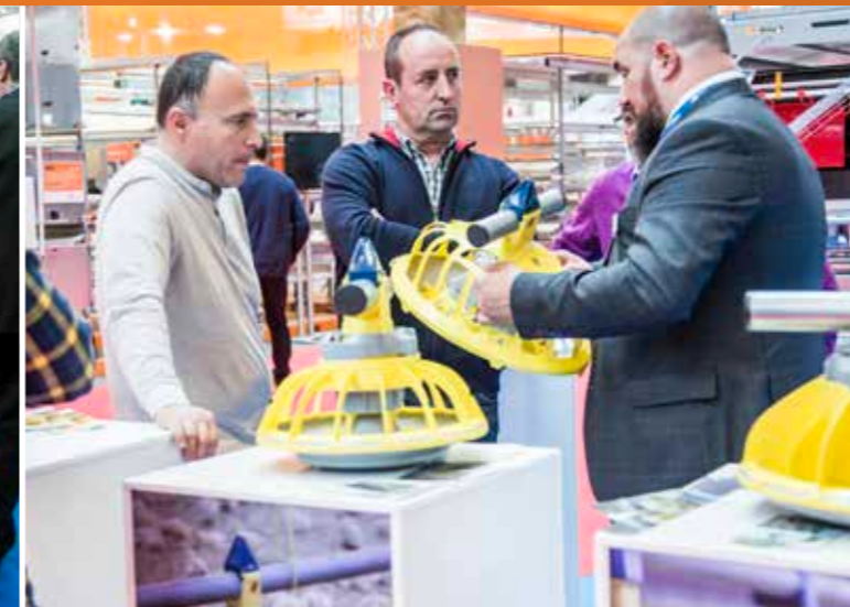
PERFIL DEL VISITANTE / VISITOR'S PROFILE