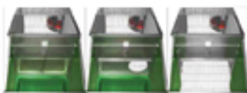
Sistema de lactancia automática.