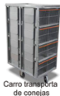
Carro transporta de conejas