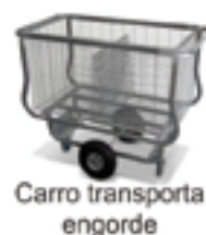
Carro transporta engorde