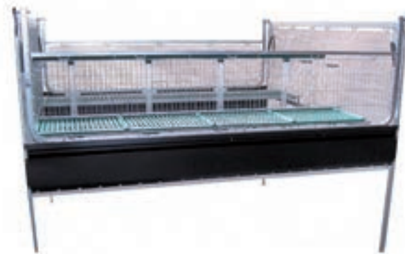
Foto 3. Sistema de suelo de slat elevado sobre fosa