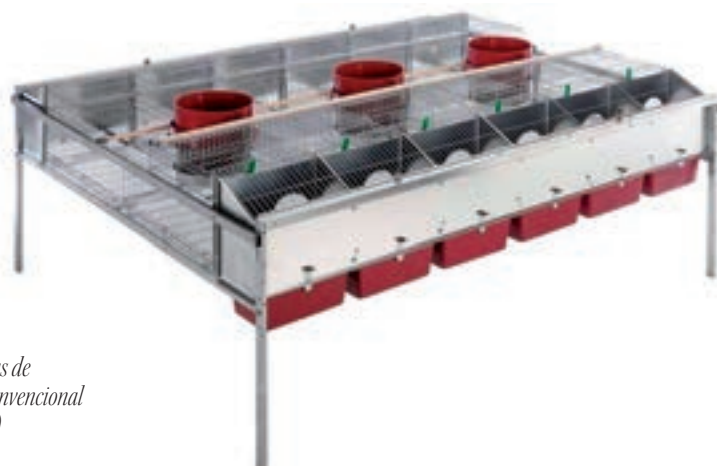
Foto 1. Módulo de jaulas de reproducción convencional

continuo con el animal a lo largo de toda su vida. Como se ha dicho, en las jaulas el más utilizado es la malla de alambre o varillas metálicas debido a su beneficio higiénico-sanitario, ya que permite la correcta evacuación de las deyecciones de los animales, y los separa de posibles focos de infección. Sin embargo, un efecto casi directo de este material al contacto con las patas de las conejas, es la aparición de pododermatitis, lesiones epidérmicas y abrasiones, favoreciendo además cambios de comportamiento debido al bajo bienestar del animal. La pododermatitis ulcerosa causa dolor y sufrimiento crónicos (Rosell et al. , 2013), así como el sacrificio de las conejas (Rosell et al. , 2009). De ahí, la necesidad de colocación de reposapatas en este tipo de suelos (Rosell et al. , 2009; Mikó et al. , 2014) y el aumento del interés por otros materiales o tipos de suelo. Por otro lado, en las jaulas individuales actualmente se está