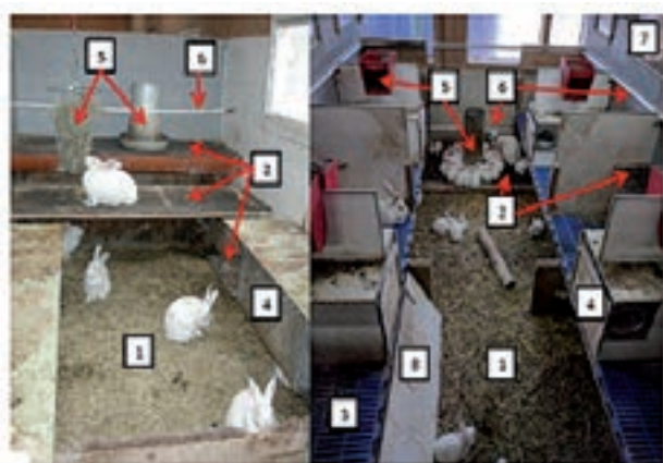
Foto 2. Conejas alojadas en un sistema en suelo con cama

Por otro lado, una alternativa a los sistemas de producción en jaula individual son los sistemas en suelo que, por lo general, se trata de sistemas grupales. En estos sistemas de producción en suelo existe una gran variedad de propuestas para la mejora del bienestar de los animales. Una posibilidad es el alojamiento con cama (paja, heno, borra y viruta) más utilizado en la fase de engorde que en la reproducción ( Foto 2 ). Este tipo de suelo presenta grandes ventajas desde un punto de vista de repertorio comportamental de los animales pero disminuye considerablemente las condiciones higiénico-sanitarias y el nivel productivo en comparación con las jaulas convencionales (Szendrő et al. , 2011). Estas diferencias varían en una disminución entre 0,8-8,0 g/día para la